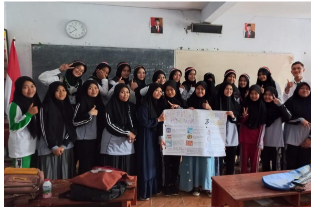
Gambar 1. Kegiatan Edukasi dan Pendidikan Kesehatan Perawatan Gigi dan Mulut di MTs Unggulan Al-Qodiri Jember

Berikut ini adalah evaluasi pengetahuan perawatan gigi dan mulut pada siswa – siswi: