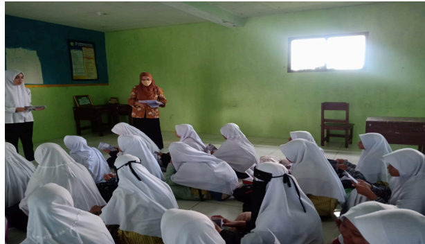
Gambar. 1. Kegiatan Edukasi dan Penyuluhan Perilaku Hidup Bersih dan Sehat

menyiapkan alat dan bahan yang digunakan. Alat dan bahan yang dipakai sebagai media penyuluhan adalah Leaflet. Leaflet disebarakan kemudian dilakukan evaluasi. Evaluasi dilakukan untuk mengetahui perubahan pengetahuan yang dimiliki oleh santri sebelum dan sesudah penyuluhan.