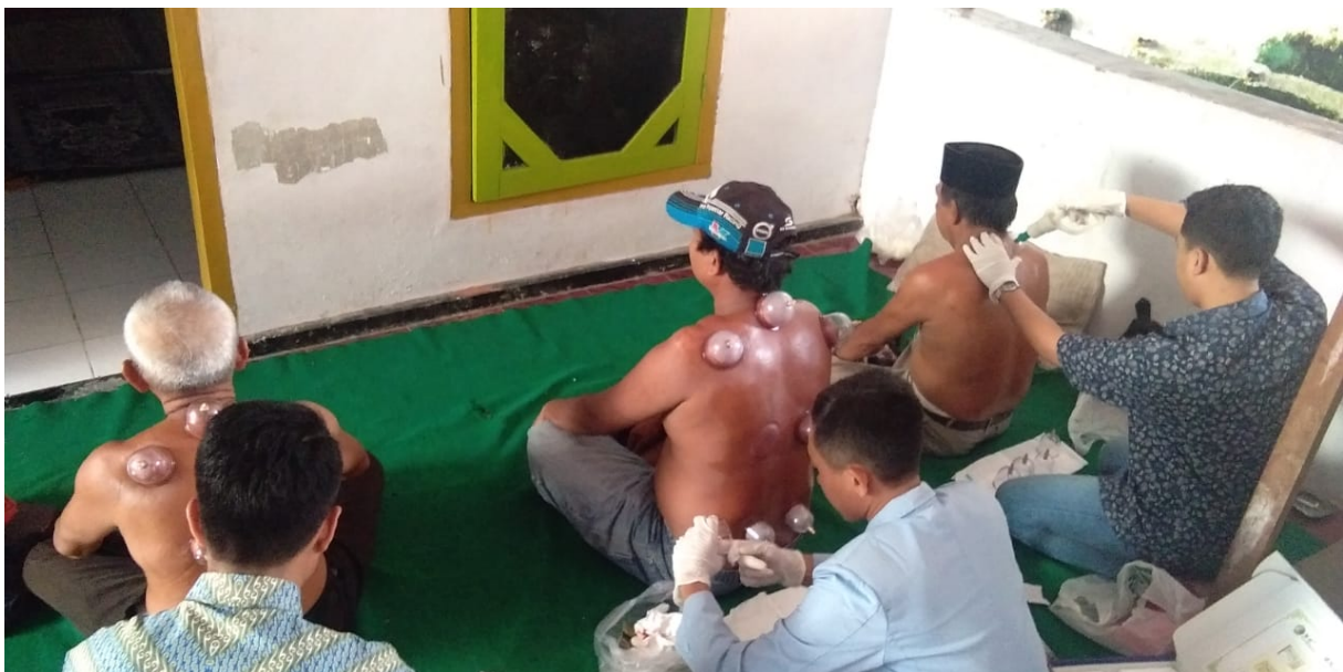
Gambar 1. Kegiatan akupuntur bekam pada warga desa mrawan

Dalam hal ini Amannesim merupakan yang paling utama dalam mengetahui penyakit sedini mungkin tahap tersebut menanyakan akan hal seperti identitas diri pasien berupa nama, usia, alamat, keluhan yang dirasakan, riwayat keluarga, riwayat penyakit sebelumnya, dan menanyakan apa kah memiliki penyakit degeneratif. Tindakan komplementer bekam dalam di lihat pada gambar kegiatan tersebut.