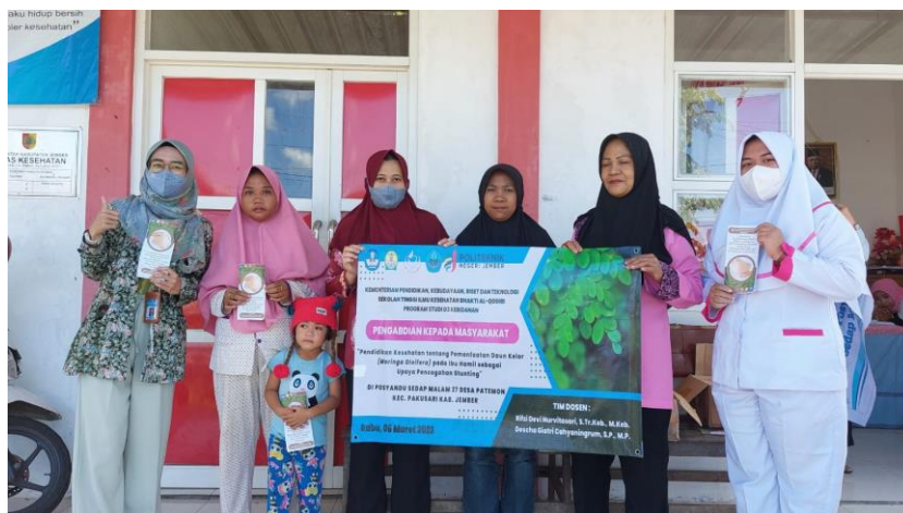
Gambar 3. Dokumentasi Akhir Kegiatan