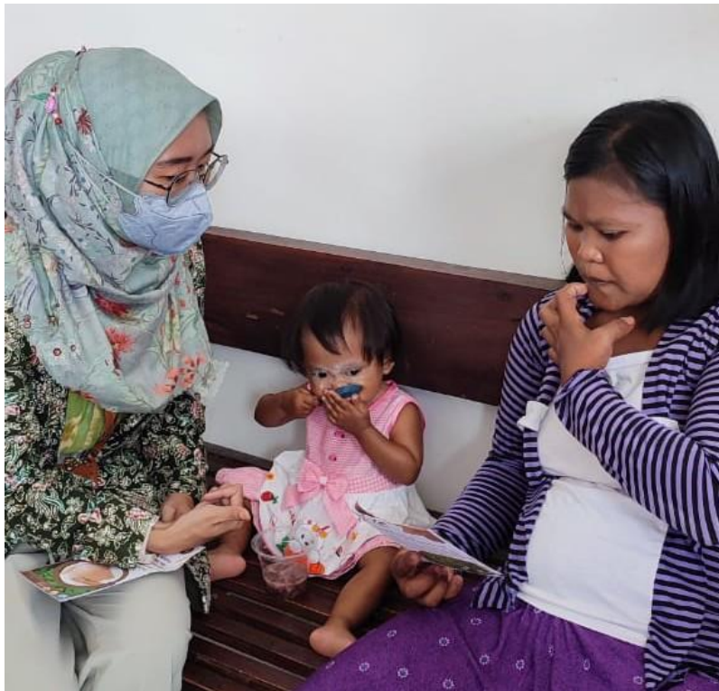
Gambar 2. Edukasi Kesehatan pada Ibu Hamil mengenai Pemanfaatan Daun Kelor sebagai Upaya Pencegahan Stunting