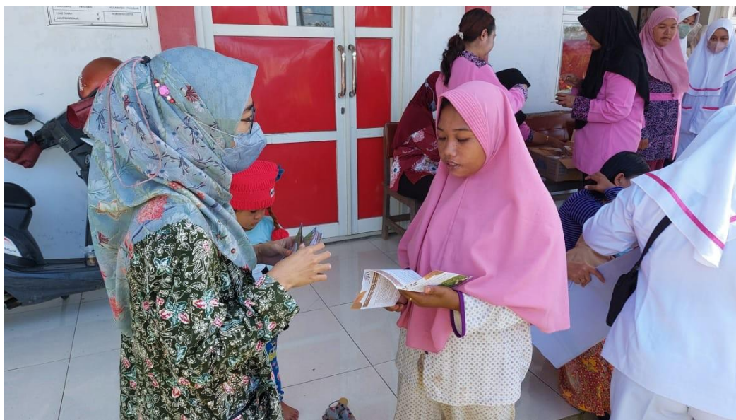
Gambar 1. Kegiatan Pendidikan Kesehatan pada Ibu Hamil mengenai Pemanfaatan Daun Kelor sebagai Upaya Pencegahan Stunting

Dalam kegiatan pengabdian kepada masyarakat ini, Posyandu Sedap Malam 27 di Desa Patemon Kecamatan Pakusari Kabupaten Jember dipilih sebagai tempat pelaksanaan program. Kemudian siapkan alat dan bahan yang dibutuhkan pada langkah selanjutnya. Materi promosi berupa alat dan bahan penunjang pendidikan kesehatan. Leaflet dibagikan dan kemudian dievaluasi. Evaluasi akan dilakukan dengan menyebarkan kuesioner dan memberikan penilaian untuk mengetahui perubahan tingkat pengetahuan ibu hamil sebelum dan sesudah pelatihan pendidikan kesehatan.